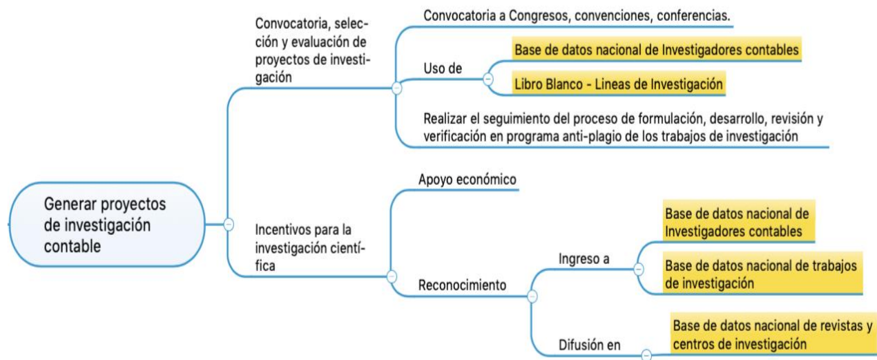
Figura1. Proceso de generación de proyectos de investigación contable.

apoyo económico lo realizará la JDCCPP con la finalidad de incentivar la publicación científica y la participación en eventos promovidos por la JDCCPP y se asignará de acuerdo con el presupuesto disponible y autorizado por la JDCCPP.